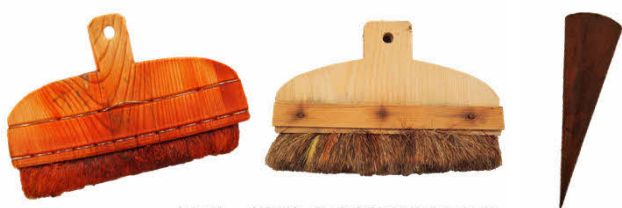
〈刷毛〉〈筒袋〉株式会社近藤染工場蔵