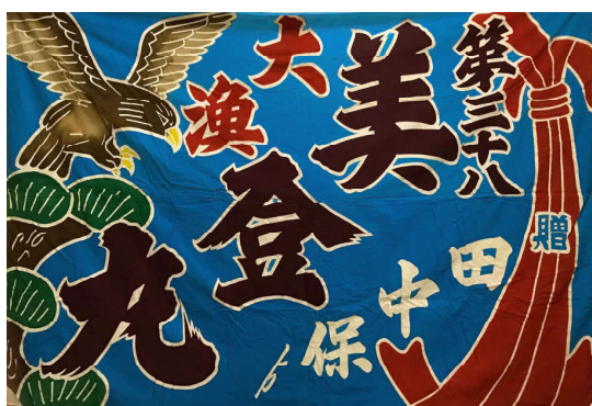
〈大漁旗 第三十八美登丸〉釧路市立博物館蔵