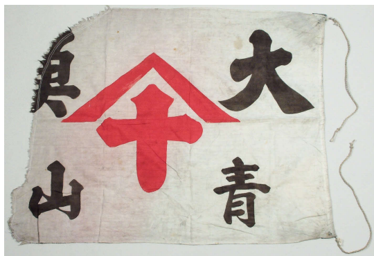
〈大漁旗 青山〉北海道博物館蔵

日本に特有の文化である大漁旗。かつては海上から陸へ大漁を伝える通信手段として、現在では進水式を迎える船主への贈り物として、大漁を願う人々に寄り添ってきました。たく力強い文字であらわされる船名に、華やかで吉祥的な文様やモチーフを効果的に組み合わせたデザインは、漁港をにぎやかにいろどります。本展では大漁旗のデザインをひもとくとともに、手仕事による大漁旗の制作手法を解説し、1枚の旗に込められた祝いと祈りの心みつめます。