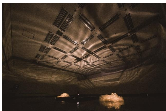
参考写真 小宮伸二 北海道立函館美術館での 展示風景 2014(平成26)年