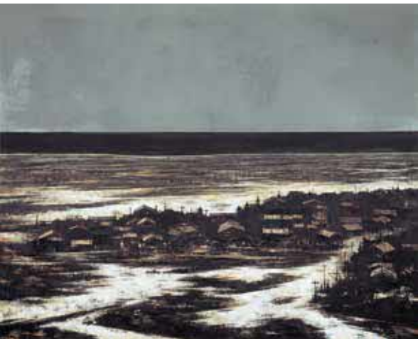
〈北の浜辺(床丹)〉1993(平成5)年 釧路市立美術館蔵 *前期展示予定