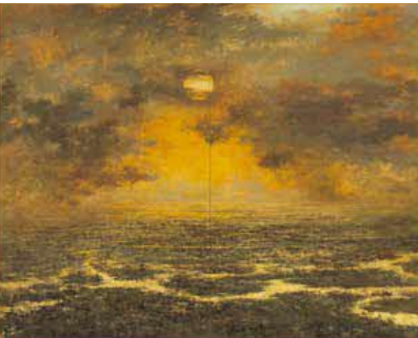
〈冬日(悠々釧路湿原)〉2015(平成27)年 北海道立釧路芸術館蔵

日本画家・羽生輝は、北海道の釧路を拠点に、これまで55年以上にわたって岬や浜辺、湿原など、道東を中心とした北国の風土をみつめ、描き続けてきました。重厚で鋭いタッチのうちに、ゆたかな抒情を滲ませた作品により確かな評価を築き、由緒ある日本画団体・創画会において北海道でただ一人の会員として活躍を重ねています。画家80歳の傘寿を記念する本展では、その初期から近年に至る代表作およそ60点を展覧します(途中一部展示替)。あわせて少年期の作品、海外取材作品、新聞連載小説の挿絵原画、関連資料等をご紹介し、その画業を多様な視点により回顧します。道東の地に根差し、生み出されてきた羽生輝の深遠な日本画の世界をご堪能ください。