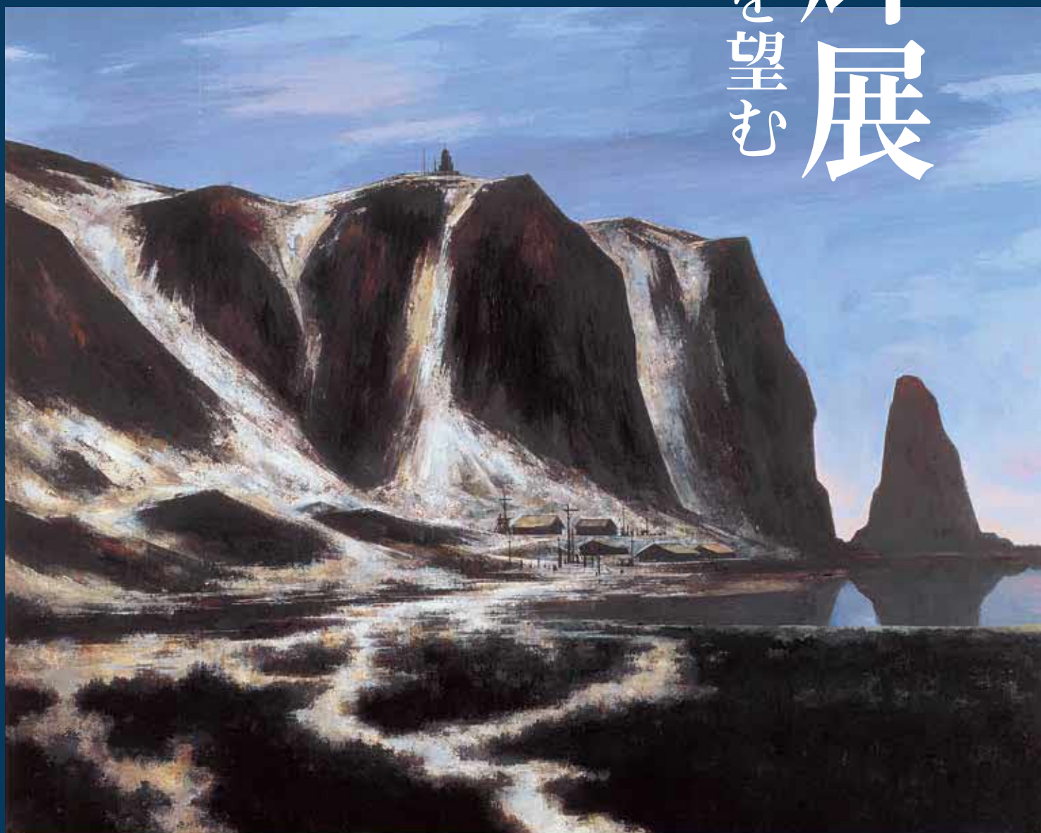
〈北の岬(知床)〉1989(平成元)年 北海道立近代美術館蔵

◎(一)内は団体(10名以上)、親子(高校生以下の子とその親)、リピーター(当館展覧会観覧券半券を提示の方)の割引料金。◎開館記念日の10月24日回は、どなたも(一)内の料金で観覧いただけます。◎「そあっこ」(釧路根室管内在住の中学生以下のみなさんは無料)釧路芸術館ボランティアの会SOAによる招待事業。◎学校の教育活動による小、中、高校生(引率者含む)の観覧は無料。◎障がい者手帳、療育手帳等をお持ちの方、及び付き添いの方は無料。特別支援学校の児童生徒、及び引率者は無料。