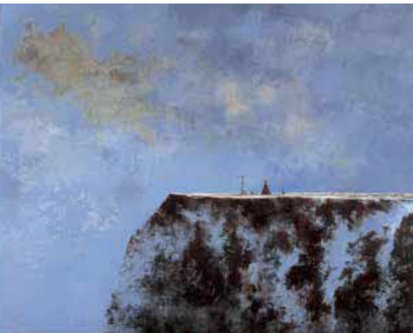
〈海霧(07. オダイト)〉2007(平成19)年 北海道立釧路芸術館蔵 *後期展示予定