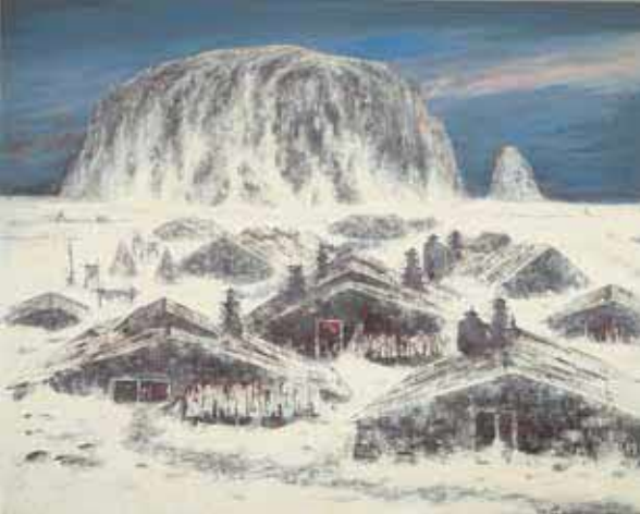
〈冬眠する浜〉1982(昭和57)年 釧路市立美術館蔵