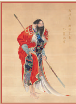
秦檜丸(東蝦夷地屏風 八)(部分) 文化4(1807)年 函館市中央図書館蔵 *10月18日から展示