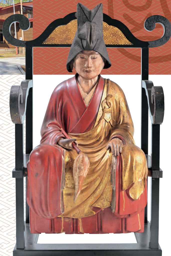
〈文翁和尚坐像〉文化5(1808)年 国泰寺蔵