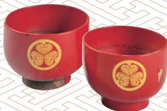
〈仏師器〉制作年不詳 厚岸町海事記念館蔵