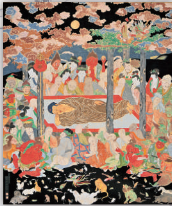
〈仏涅槃図〉文化3(1806)年 国泰寺蔵