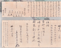
【重要文化財】〈仏舎利授受之書〉文化2(1805)年(ほか) 国泰寺蔵 *10月16日まで展示