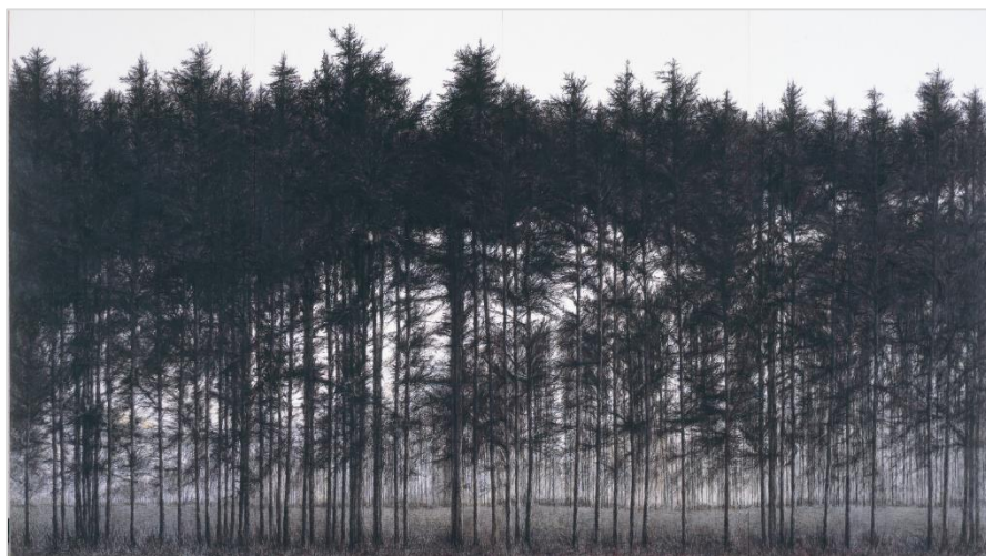
(左) 高坂和子《林の光景》 油彩、キャンバス 1991年 (右) 日高理恵子《落葉松》 岩絵具、麻紙 1987年 ©日高理恵子

当館が所蔵する二人の作家、高坂和子と日高理恵子の作品の魅力について、北海道立近代美術館の中村聖司学芸副館長にお話しいただきます。作品鑑賞が楽しくなる、とっておきの話をぜひお聞きください。