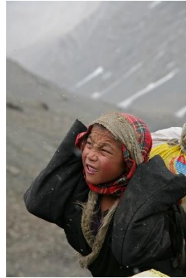
長倉洋海 《シルクロード：冬虫夏草をとり山に向かう少年》2008年 当館蔵 © H. Nagakura