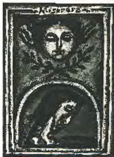
ジュールジュ・ルオー「ミセレーレ」 神よ、われを憐れみたまえ、あなたのおおいなる慈しみによって 1923年、刊行:1948年 © ADAGE, Paris & JASPAR, Tokyo, 2022 E4619 *8月7日(日)まで展示

巨匠たちの手によって紡ぎだされた版画ならではの表現の数々を、この機会にぜひお楽しみください。