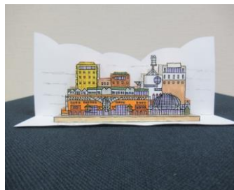
<釧路フィッシャーマンズワーフMOOとNTT DOCOMO釧路ビルなど>