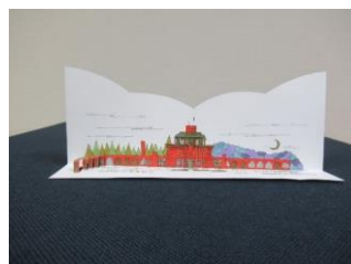
<釧路市湿原展望台>